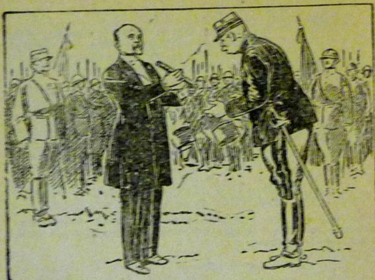
Joffre reçoit des mains du Président de la République son bâton de maréchal (p. 18).

commandement de ne point tenter ce qu'ils jugeaient eux-mêmes impossible!