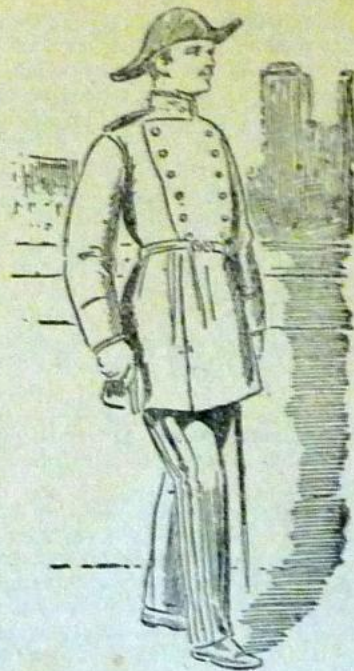
Joffre polytechnicien (p. 4).

Or, la colonne Joffre, à travers mille embûches, parvint, saine et